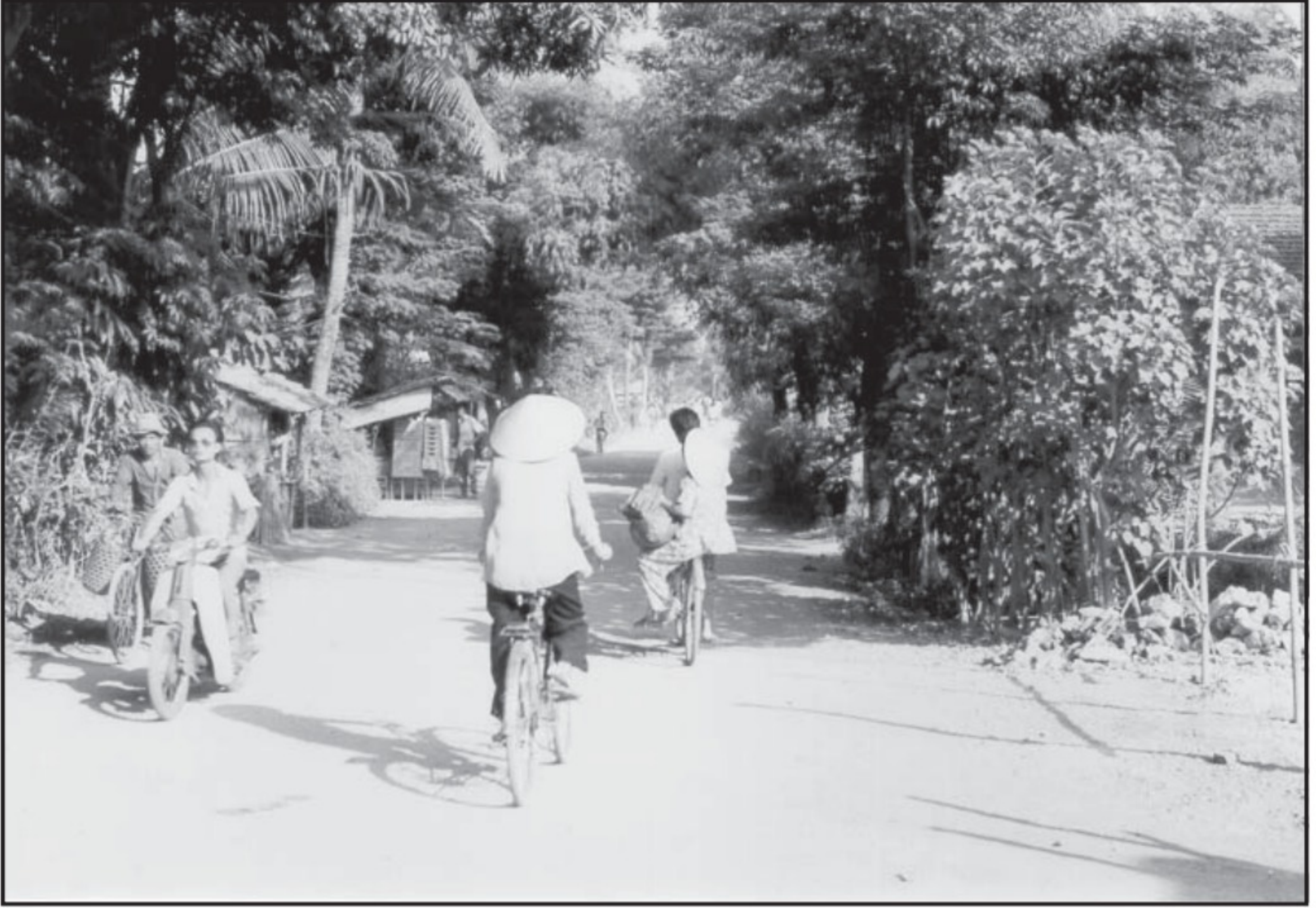
Đường đi Ba La, Vạn Tượng