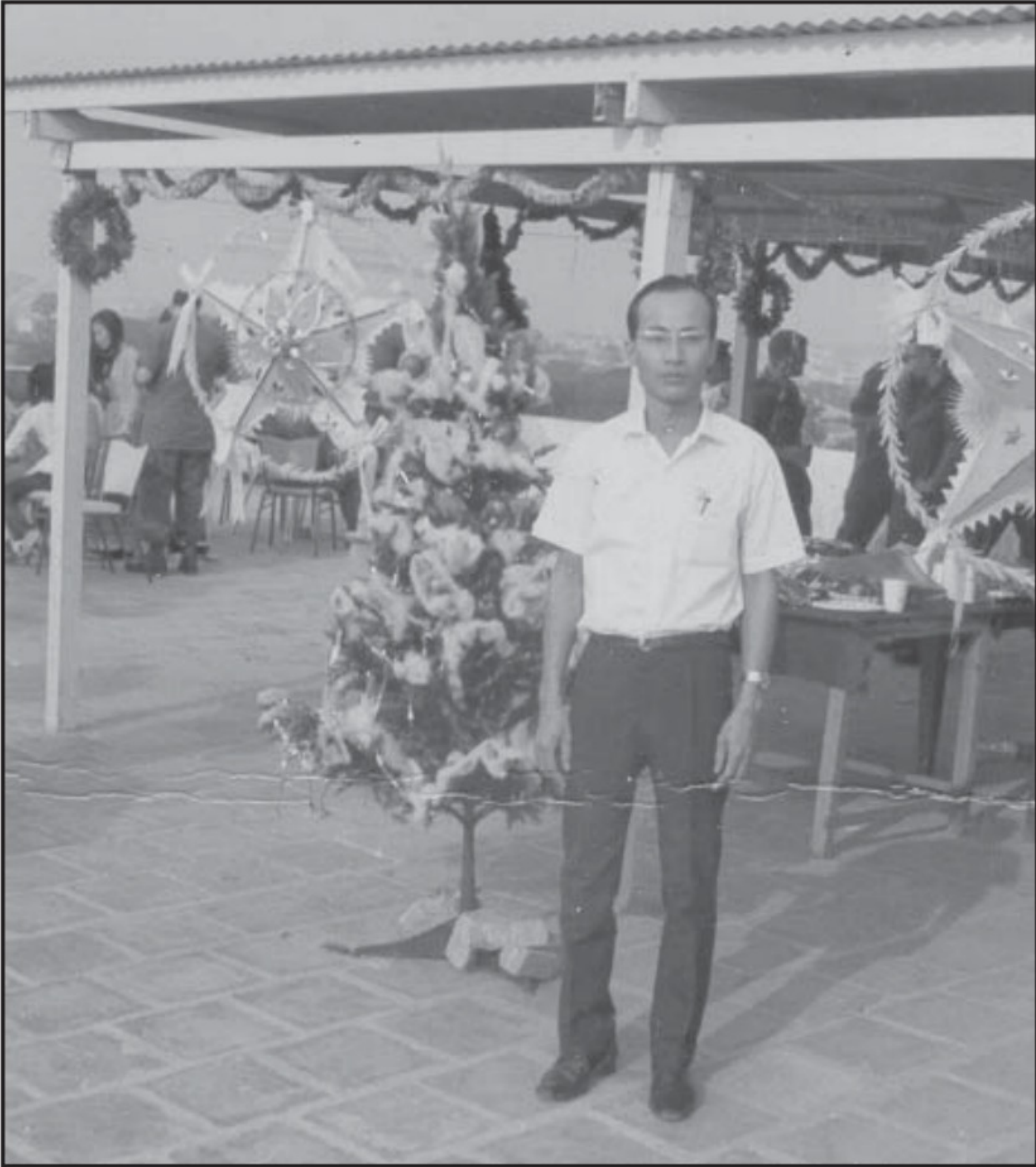
Tác giả lúc 31 tuổi.