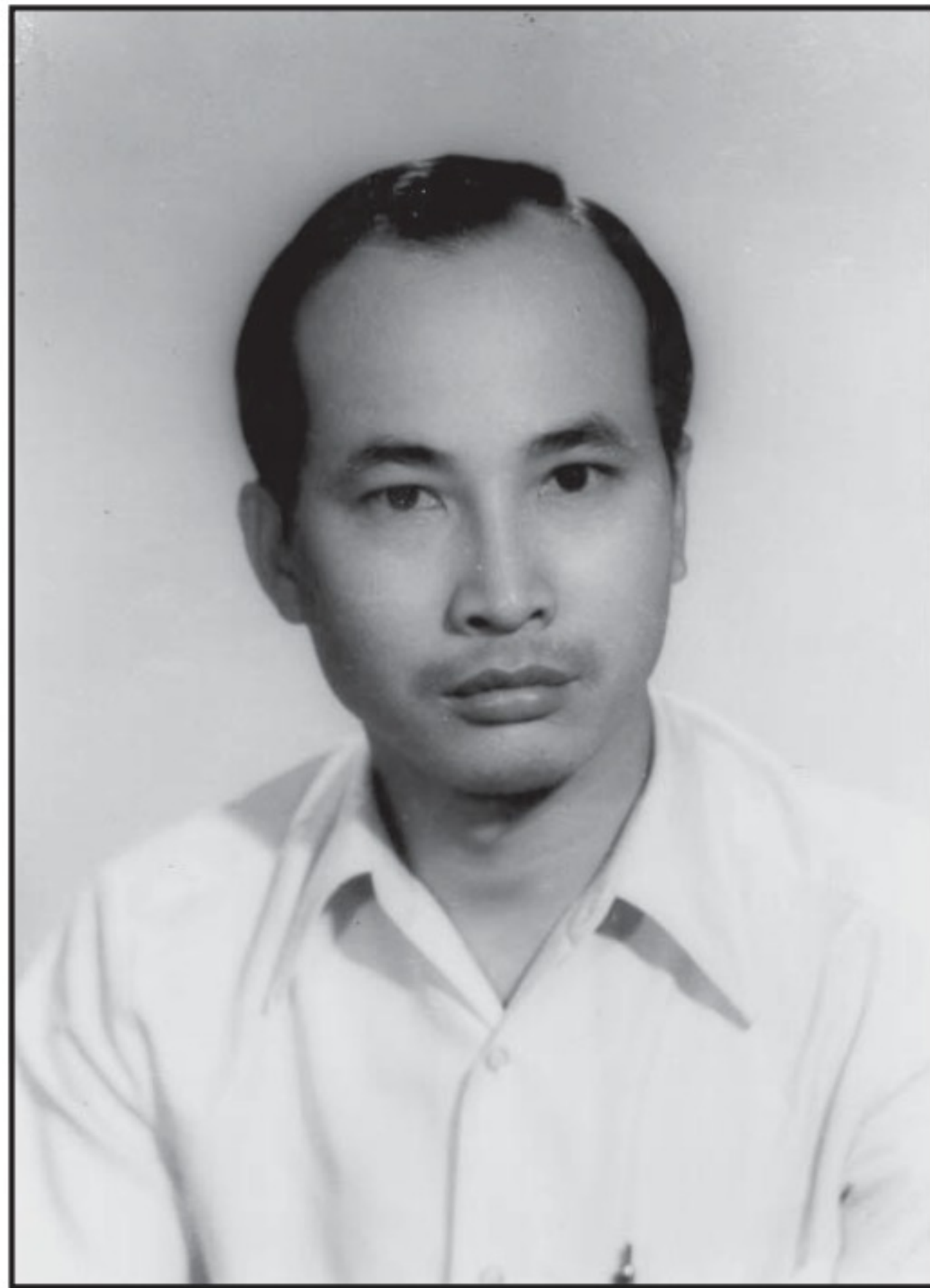
Tác giả lúc 38 tuổi.