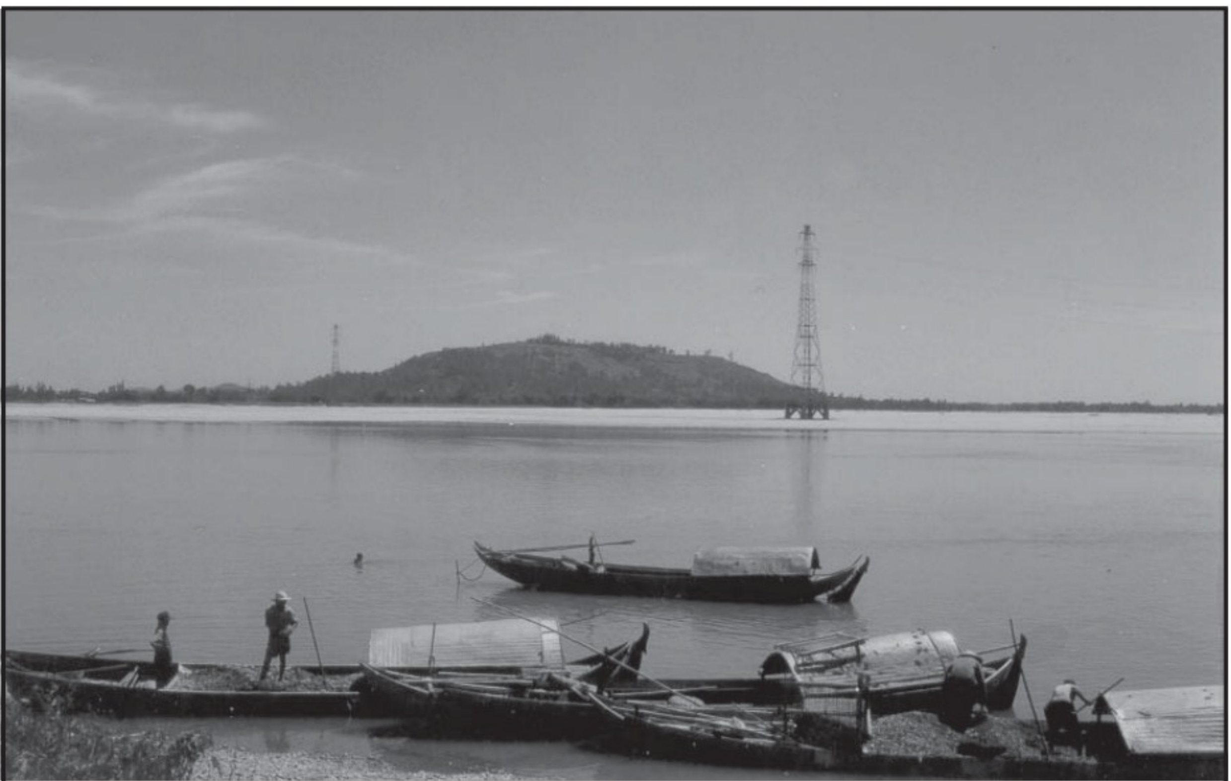
Bến Tam Thương