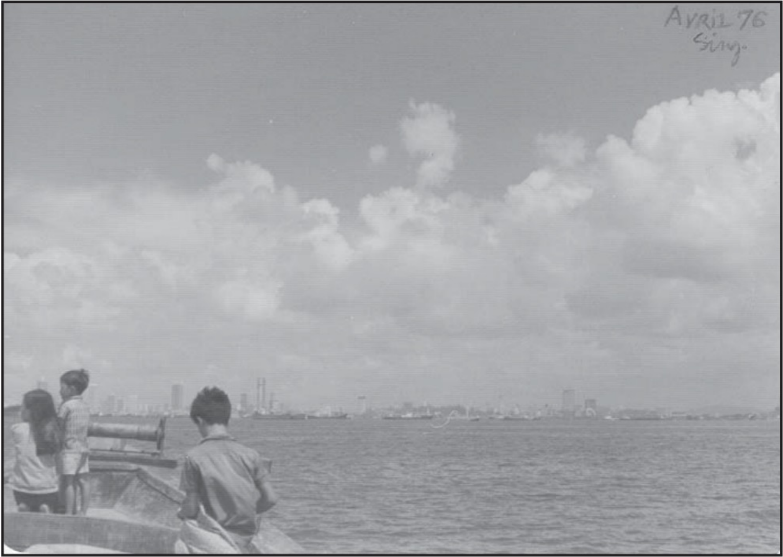
Đường vào Singapore.