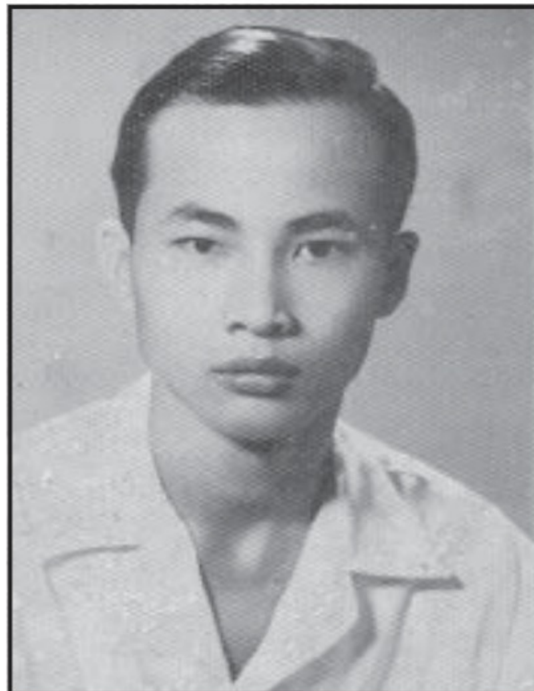
Tác giả lúc 21 tuổi.