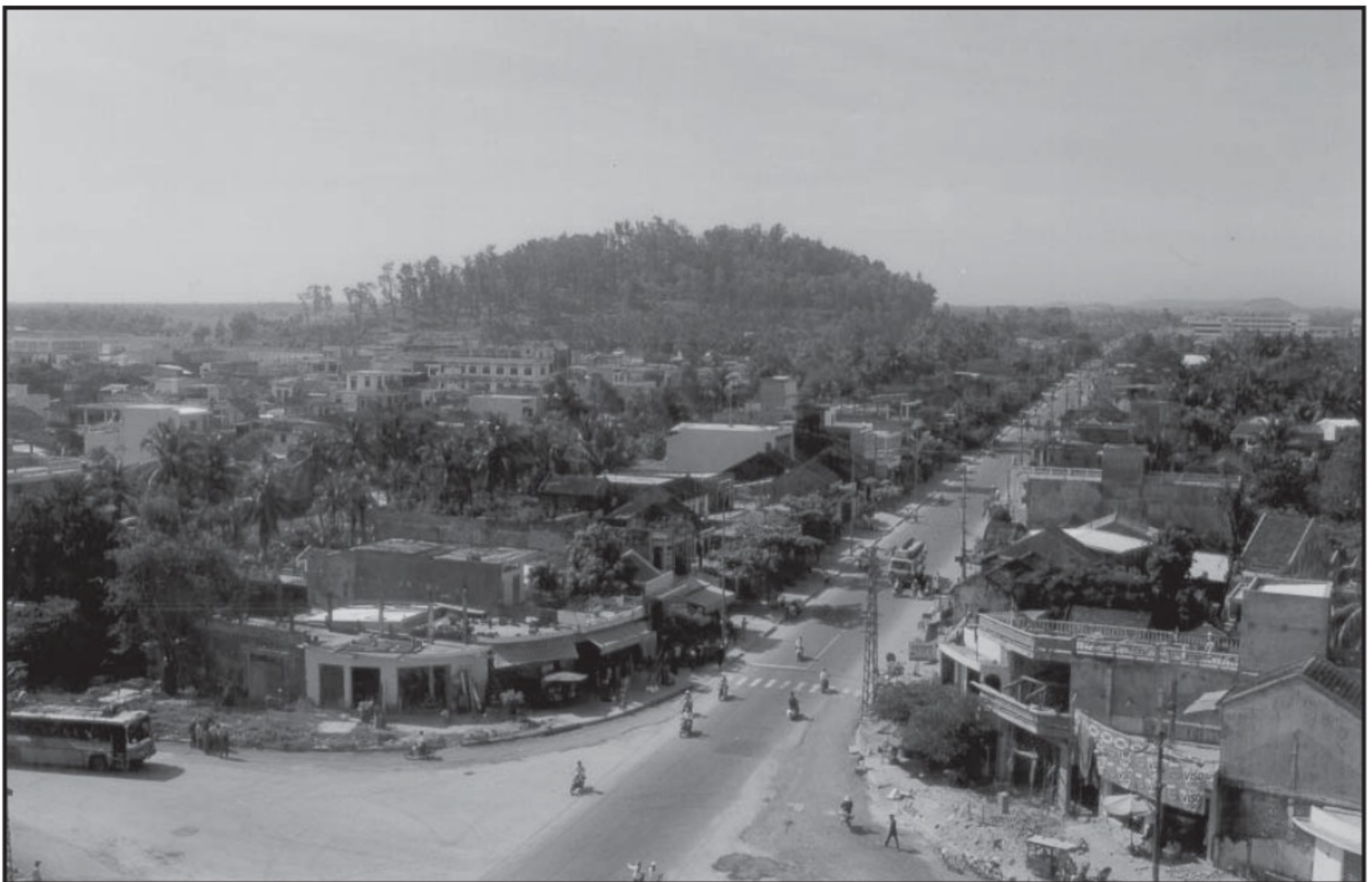
Núi Thiên Bút.