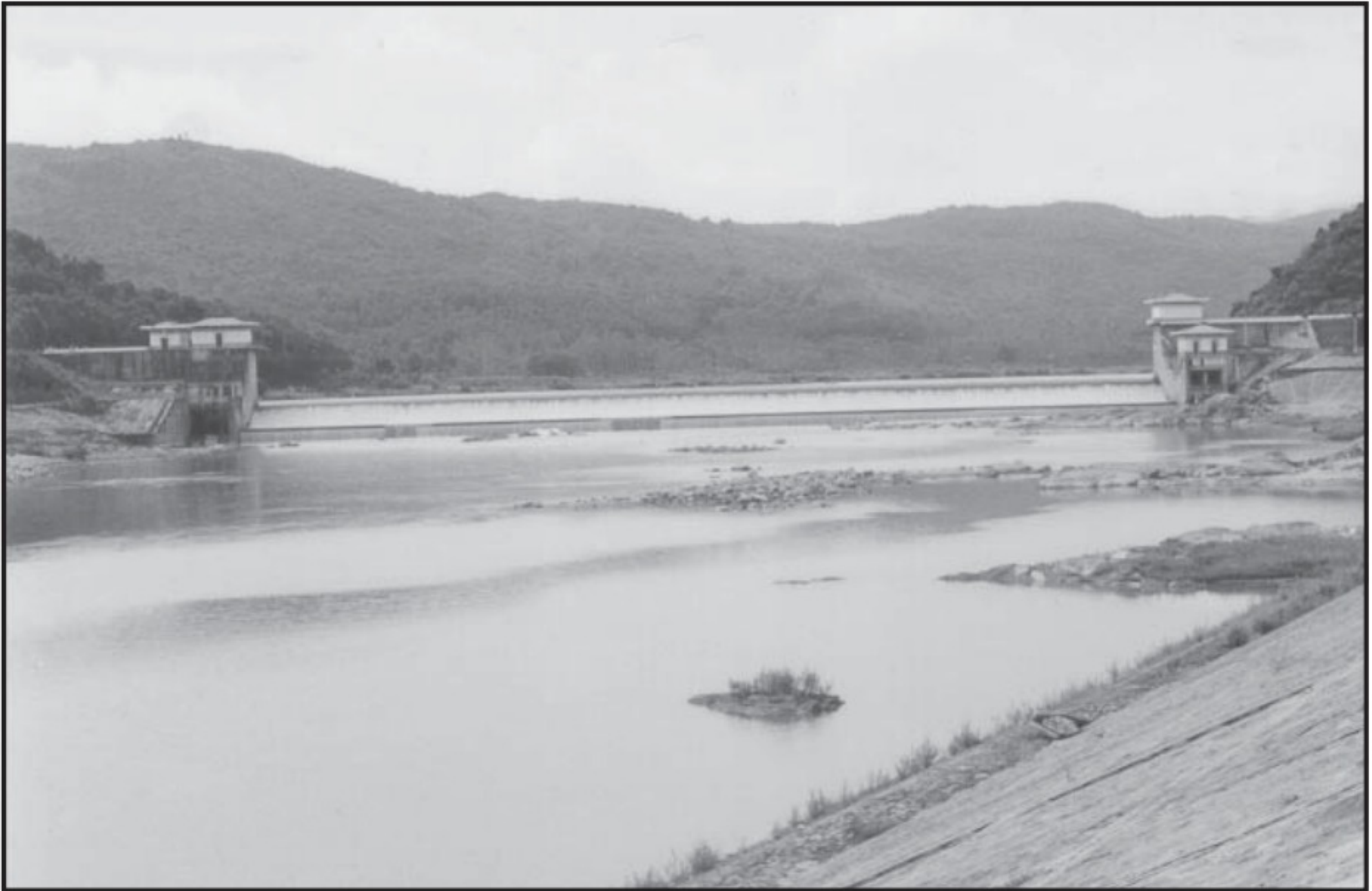
Đập Thạch Nham