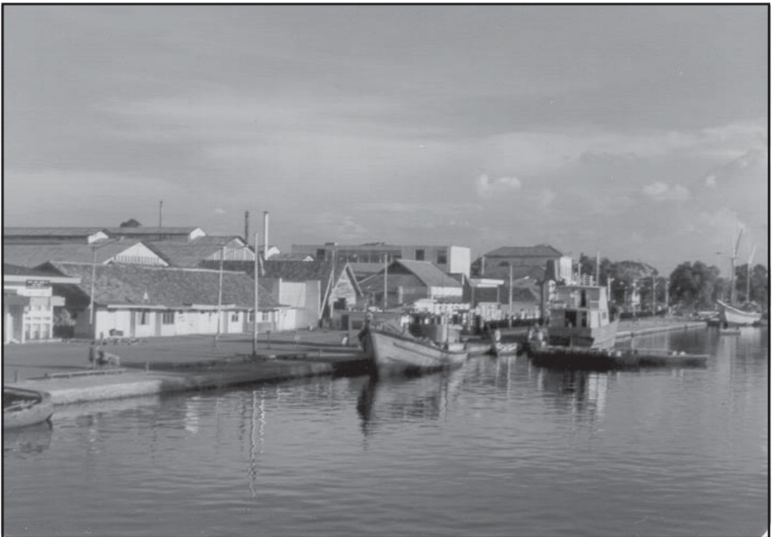
Thuyền tác giả tại cảng Sunda Kelapa, Jakarta.