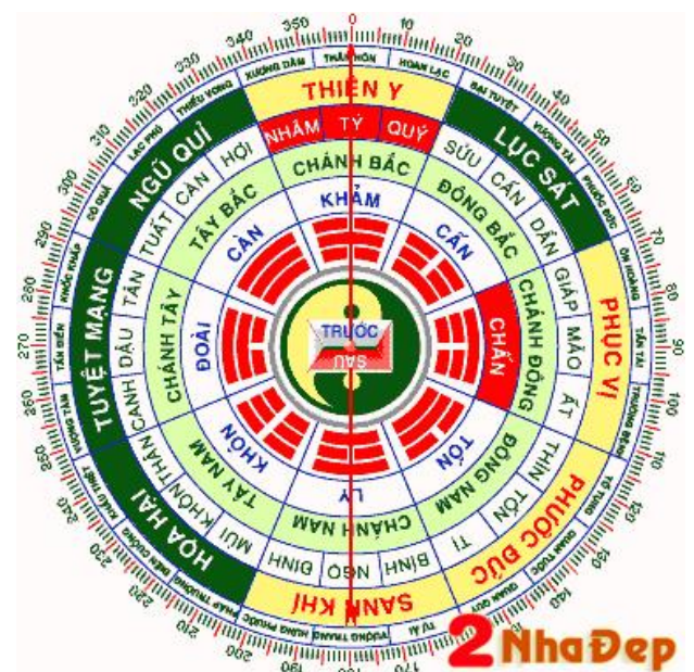
Bản Đồ PHONG THỦY

Nguyên tắc về Phong Thủy đã có từ cả hàng ngàn năm trước. Phong Thủy là không khí và nước, hai nguồn năng lượng cần thiết cho sự sống của một con người. Sức khỏe cũng do năng lượng nhiều hay ít, đủ hay thiếu. An cư lạc nghiệp, phải có một nơi ở ổn định mới yên tâm làm việc được. Nhà ở là một tổ ấm rất cần thiết để giúp con người có thêm được năng lượng, có thêm sức khỏe để phấn đấu với cuộc đời. Ngoài sự xây cất bền vững của ngôi nhà, có những yếu tố không phải là duy tâm mà là khoa học để làm cho căn nhà thật thuận lợi cho cuộc sống của người ở trong nhà. Phong Thủy mang lại những yếu tố đó. Theo quan niệm kiến trúc phương Tây: hai yếu tố rất quan trọng cho một ngôi nhà là: éclairage et aération (ánh sáng và thông thoáng). Trên các bộ cửa chính và cửa sổ có gắn thêm các bộ cửa sổ bật để lấy ánh sáng và gió đi vào ngôi nhà. Một căn nhà sáng sủa thoáng mát sẽ giúp cho người trong nhà luôn luôn có một cảm giác thoải mái tăng sức khỏe. Mặt tiền của căn nhà không hướng thẳng theo hướng mặt trời (hướng Đông) mà phải xiên một góc 45 độ. Hướng Đông Nam là hướng thích hợp nhất cho ngôi nhà.