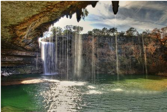
Cảnh đẹp thiên nhiên của hồ Hamilton