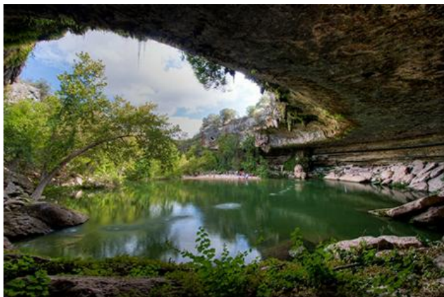
Vòm thạch nhũ làm mái che nắng cho du khách

hình thành do quá trình ngưng tụ của Calci carbonate trải qua hàng nghìn năm.