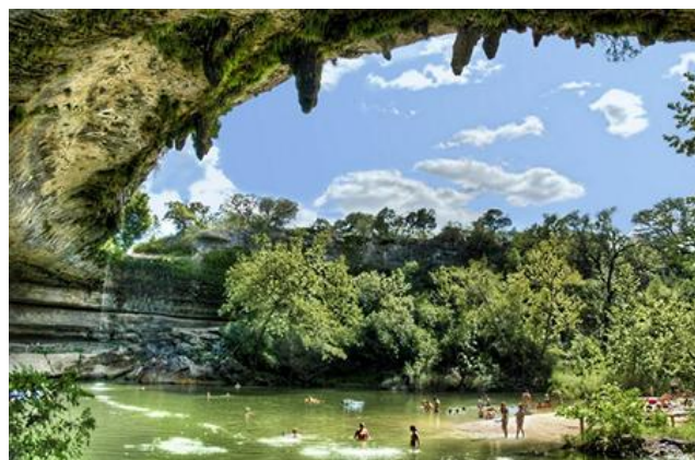
Du khách đang hưởng cảnh thanh tịnh

Ở những vùng đất cao quanh khu vực hồ là cây Juniper và cây Sồi cùng với cỏ và hoa dại, bên cạnh đó cũng có nhiều chủng loại cây rất quý hiếm khác.